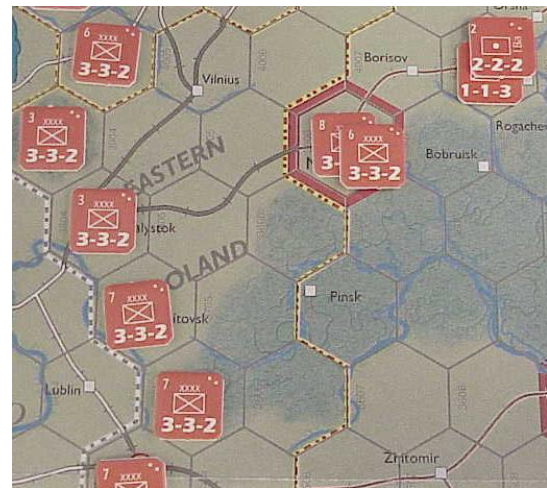
Front Centre, la ville-objectif est Minsk.