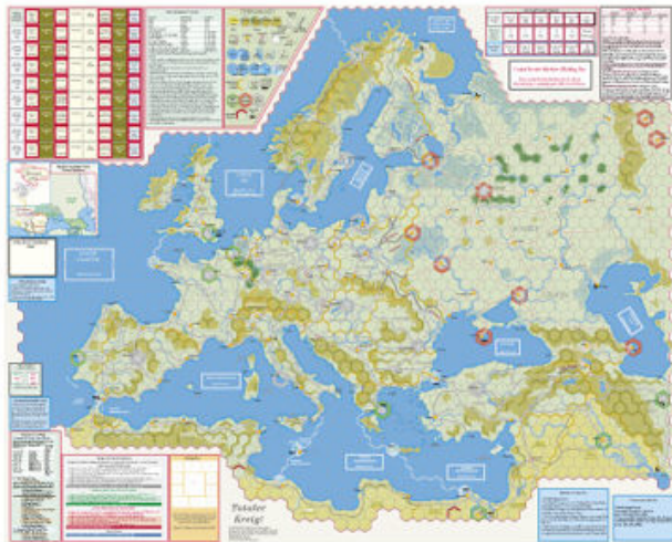
La carte de Totaler Krieg.

Autre défaut les règles ne sont pas un modèle de clarté. A la première lecture on voit difficilement où l'auteur veut en venir. L'idéal est d'être initié par une personne maîtrisant déjà le jeu. Par contre les Designer's Notes sont assez conséquentes et apportent vraiment un plus à la compréhension du jeu. Une lecture appliquée de cette partie est chaudement recommandée.