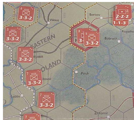
Front Centre, la ville-objectif est Minsk.