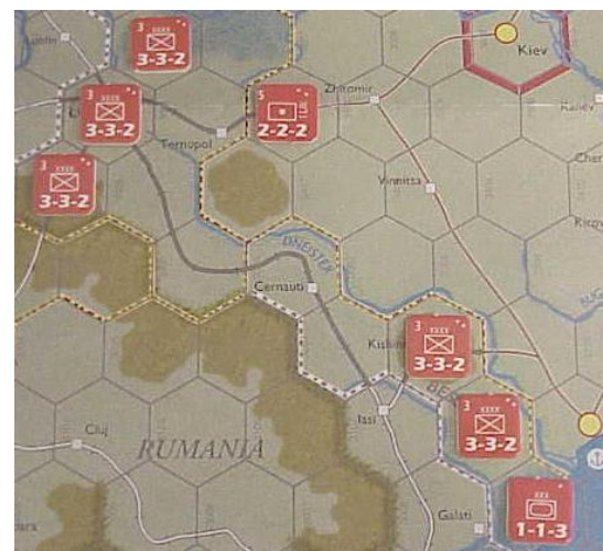
Front Sud, le pion 2-2-2 avec le symbole d'artillerie est un QG.