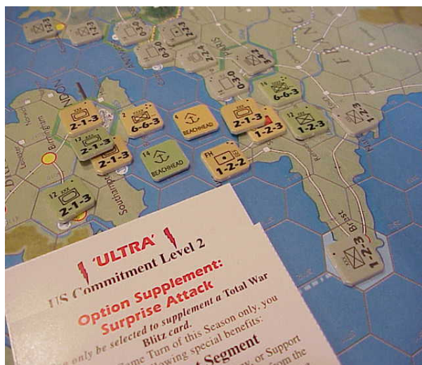
Fig 1. Tête de pont en Normandie

- La gestion des débarquements est assez originale. Lorsqu'un joueur obtient la supériorité dans une zone navale il peut retourner le pion de flotte (aérien ou naval mais pas sous-marin bien évidemment) afin d'obtenir un pion Beachhead (tête de pont). Ce pion placé sur un hex de pleine mer adjacent à une côte agit comme un port allié ainsi des unités à un step peuvent y accoster pour ensuite entrer sur la terre ferme. Plus surprenant si le pion Beachhead est placé sur une case de pleine mer entre deux cases côtières alors le pion Beachhead fera office de « pont » (cf. fig 1) et permettra le passage d'unités à plusieurs steps. Cela permet des opérations telles que Overlord.