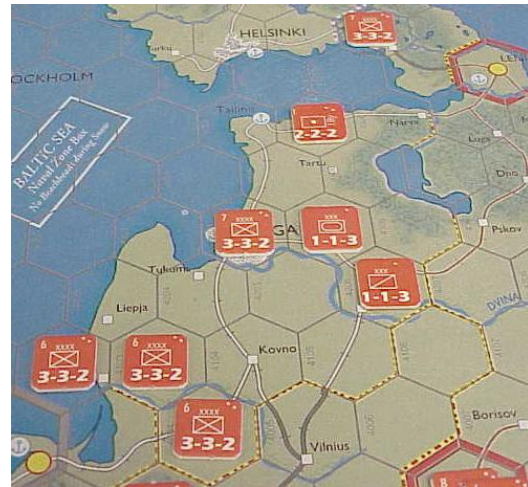
Front Nord (on voit Léninegrad au fond).

Ces 3 photos ci-contre montrent un placement russe typique afin de faire face à une offensive allemande en 1941.