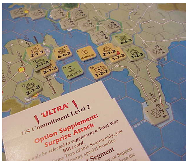
Fig 1. Tête de pont en Normandie

- La gestion des débarquements est assez originale. Lorsqu'un joueur obtient la supériorité dans une zone navale il peut retourner le pion de flotte (aérien ou naval mais pas sous-marin bien évidemment) afin d'obtenir un pion Beachhead (tête de pont). Ce pion placé sur un hex de pleine mer adjacent à une côte agit comme un port allié ainsi des unités à un step peuvent y accoster pour ensuite entrer sur la terre ferme. Plus surprenant si le pion Beachhead est placé sur une case de pleine mer entre deux cases côtières alors le pion Beachhead fera office de « pont » (cf. fig 1) et permettra le passage d'unités à plusieurs steps. Cela permet des opérations telles que Overlord.